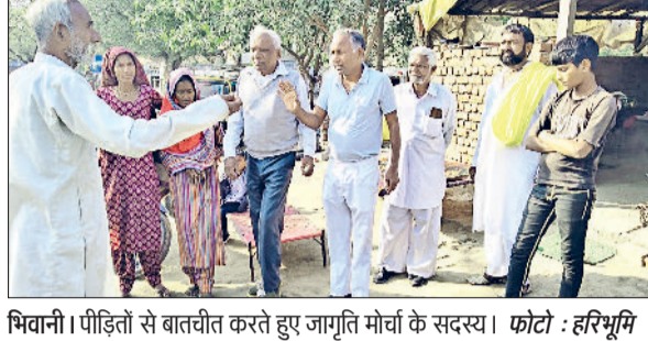
भिवानी। पीड़ितों से बातचीत करते हुए जागृति मोर्चा के सदस्य।