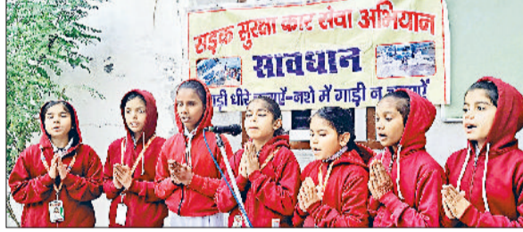
मिवानी। गीता के श्लोक का उच्चारण करते हुए।