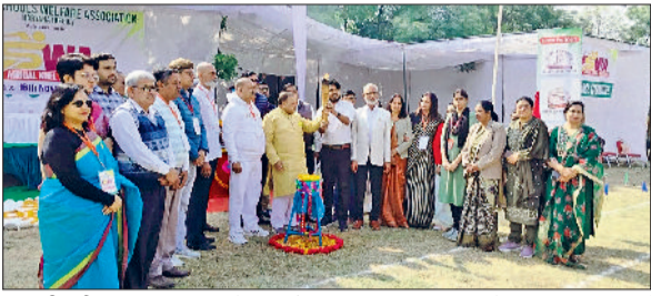
मिवानी। दीप प्रज्वलित करके प्रतियोगिता का शुभारंभ करवाते हुए अतिथि तथा खेलकूद प्रतियोगिता में भाग लेते प्रतिभागी।