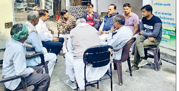
भिवानी। इंद्रक कार्यालय में केंद्रीय ट्रेड यूनियनों व कर्मचारी संगठनों की संयुक्त बैठक में विचार-विमर्श करते मजदूर नेता।