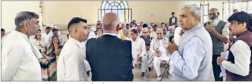
एकत्रित लोगों को संबोधित करते हुए पूर्व मंत्री जेपी दलाल।

वे सोमवार को कस्बे के ब्रह्मदत्त मेमोरियल हॉल में बहल के नागरिकों व अधिकारियों के साथ बैठक कर कस्बे में सीवरेज, पेयजल परियोजनाओं के कार्यों की समीक्षा कर रहे थे। उन्होंने कहा कि