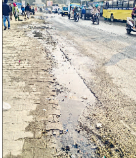
सड़कों पर बिखरा पानी का दृश्य।

तोशाम में जहां एक तरफ पीने के पानी की सप्लाई करीबन 10 दिनों में एक बार हो रही है वहीं पर स्थानीय सुरेंद्र सिंह चौक के नजदीक पानी सप्लाई की पाइपलाइन करीबन 1 महीने से अधिक समय से लीक है, जिससे हजारों लीटर पानी व्यर्थ सड़कों पर बह रहा है। लेकिन व्यर्थ बह रहे इस पानी की सुध लेने वाला कोई नहीं है जिससे राहगीर तथा दुकानदार काफी परेशान है।