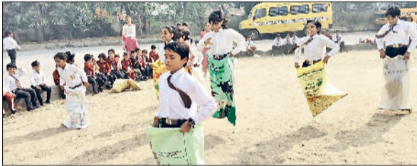
तोशाम। प्रतियोगिता की बोरा दौड़ स्पर्धा में भाग लेते प्रतिभागी।

बाबा मुंजीपा विद्यापीठ वरिष्ठ माध्यमिक विद्यालय बुशान में चल रहे तीन दिवसीय खेल महोत्सव का इन्द्रप्रस्थ हाउस के ओवरऑल विजेता बनने के साथ समापन हुआ। खेल महोत्सव में लगभग 350 बच्चों ने विभिन्न खेलों में हिस्सा लिया। नर्सरी से तीसरी कक्षा के बच्चों के लिए फरोग रेस, 100 मीटर की रेस तथा लोमन रेस रखी गई। चौथी कक्षा से आठवीं कक्षा तक के विद्यार्थियों के लिए 100 मीटर रेस, श्री लेग रेस, लंबी कूद तथा बॉरी रेस रखी गई तथा कक्षा नौवीं से बारहवीं के बच्चों के लिए 100 मी. रेस, 400 मी. रेस, लंबी कूद, शोट पुट, बैडमिन्टन, रस्साकसी तथा वालीबॉल जैसी खेल प्रतियोगिताएं करवाई गईं। अलग-अलग