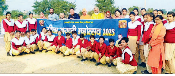
मिवानी। जोहड़ीवाला प्राचीन हनुमान मंदिर में पहुंची कन्या गुरुकुल की छात्राएं।